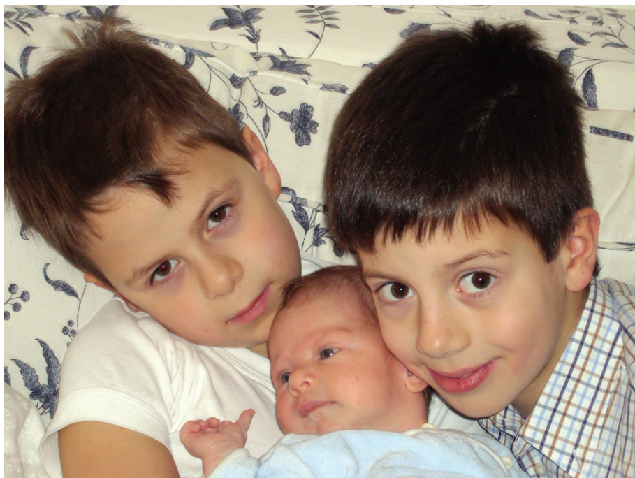
Ο άνθρωπος γεννιέται δυνάμει πρόσωπο και μπορεί νά γίνει εν ενεργεία πρόσωπο όταν επιτύχει τό καθ' ομοίωση.

Η εμπειρική θεολογία δείχνει και διαφυλάσσει την οδό ευρέσεως του αληθινού προσώπου, κάτι που δεν μπορεί να επιτύχει η ακαδημαϊκή θεολογία. Πολλοί ομιλούν σήμερα περί προσώπου, αλλά με έναν νοησιαρχικό, φιλοσοφικοθρησκευτικό και ακαδημαϊκό τρόπο 53 , ο οποίος το πολύ πολύ οδηγεί στην μετάλλαξη του «ειδεχθούς προσω--πείου» σε «διανοητικού προσω--πείου» ή σε μία «προ-σωποποίηση» του νεωτερικού ατόμου με ορθόδοξο θεολογικό μανδύα, αλλά σίγουρα όχι προσώπου. Μόνο με την θεωρητική κατάρτιση, δίχως την άσκηση, δεν μπορεί να επιτευχθεί η ορθόδοξη πνευματική ζωή, δεν αναδύεται το πρόσωπο. «Ου γαρ οι ακροαταί του νόμου δίκαιοι παρά τω Θεώ, αλλ' οι ποιηταί του νόμου δικαιο--θήσονται» 54 , λέει ο απόστολος Παύλος. Οι Πατέρες τονίζουν ότι η αληθινή θεωρία έρχεται ως επιβράβευση της αληθινής πρακτικής, «πράξις θεωρίας επίβασις» και όχι το αντίθετο. Είναι αυτό που έλεγε ο μακάριος Γέροντας Εφραίμ Κατουνακιώτης, ότι από την υπακοή θα έρθει η προσευχή, και από την προσευχή θα έρθει η θεολογία. Οι σύγχρονοι μακάριοι Γέροντες όπως ο Γέροντας Σωφρόνιος, ο Γέροντας Παΐσιος, ο Γέροντας Πορφύριος, ο Γέροντας Εφραίμ Κατουνακιώτης, ο Γέροντας Ιάκωβος Τσαλίκης, ο Γέροντας Σίμων Αρβανίτης, ο Γέροντας Αμβρόσιος αποτελούν τα πιο απτά παραδείγματα αληθινών και αιωνίων προσώπων.