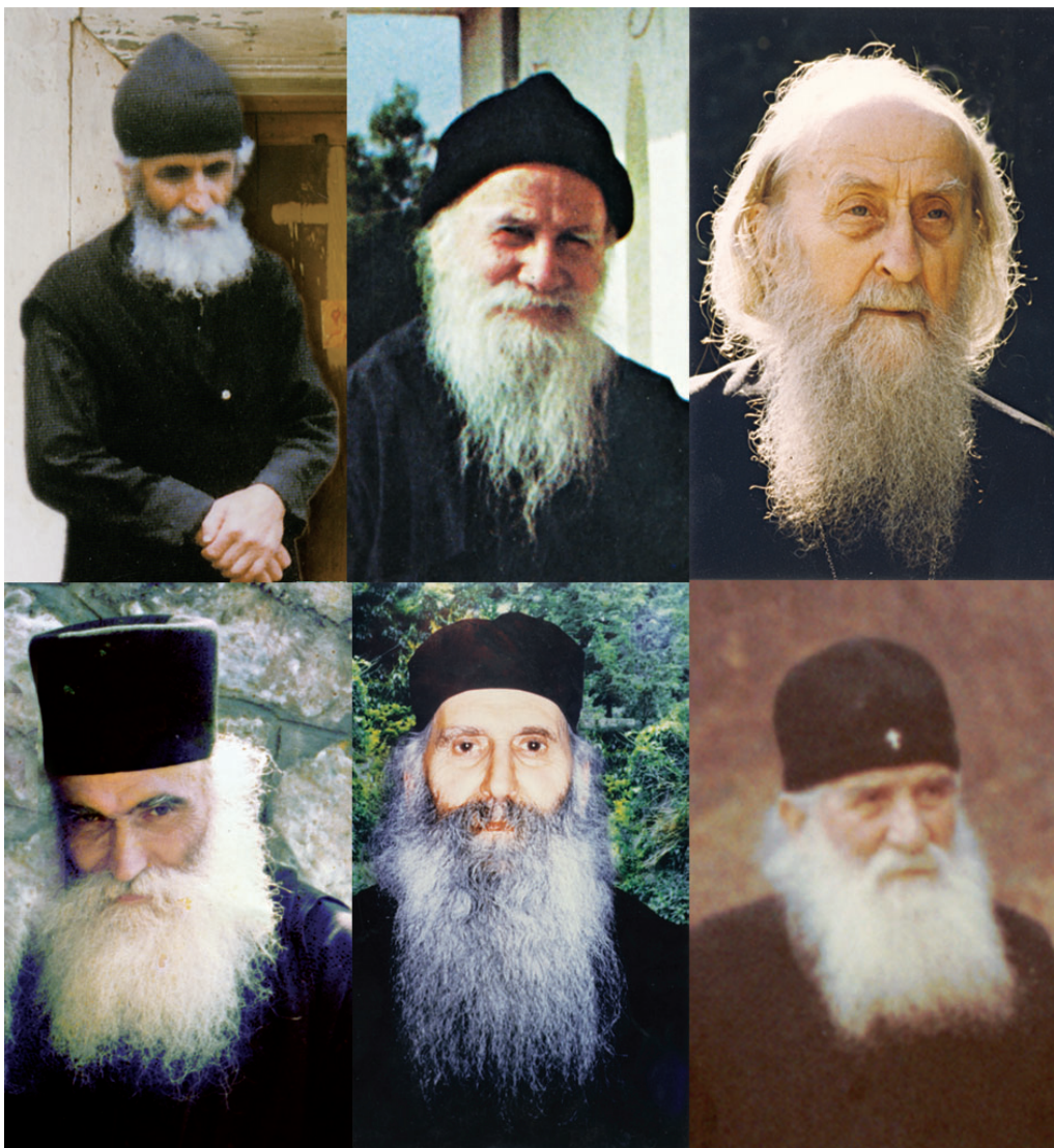
Οι σύγχρονοι μακάριοι χαρισματούχοι Γέροντες αποτελούν τά πιά απτά παραδείγματα αληθινών καί αιωνίων προσώπων.

Η θέωση, κατά τους Πατέρες, δεν είναι ένα ηθικό γεγονός, αλλά μία οντολογική κατάσταση. Η κτιστή ανθρώπινη φύση ενώνεται, «ζυμώνεται» με τον Τριαδικό Θεό, δια των ακτίστων ενεργειών, όχι όμως και κατ' ουσία 46 . «Η θέωση αποτελούσε εξαρχής τον μύχιο πόθο της ανθρωπίνης υπάρξεως. Όταν προσπάθησε ο Αδάμ να την σφετερισθεί δια της παραβάσεως της εντολής του Θεού, απέτυχε, και βρήκε αντί αυτής την φθορά και τον θάνατο. Η αγάπη όμως του Θεού δώρισε σε αυτόν, δια της ενανθρωπήσεως του Υιού Του, και πάλι την δυνα-τότητα της θεώσεως» 47 .