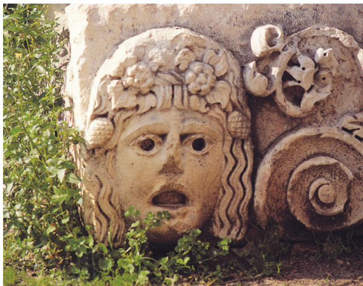
Ο σύγχρονος μετανεωτερικός άνθρωπος πρέπει να απαλλαγεί από τό εμπασθές προσωπείο του.