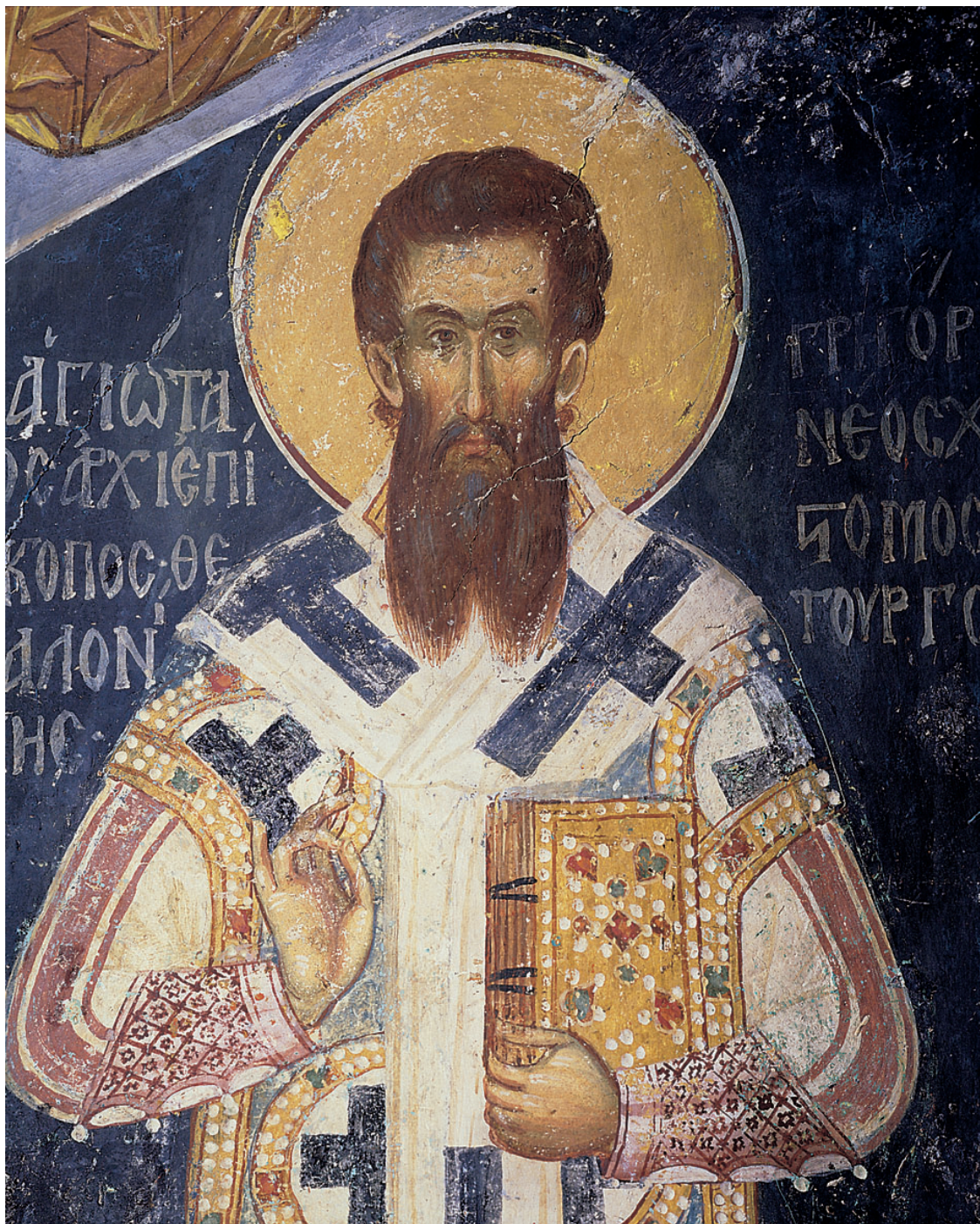
Ο Άγιος Γρηγόριος ο Παλαμάς. Τοιχογραφία παρεκκλησίου Αγ. Αναργύρων Ι.Μ.Μ. Βατοπαιδίου, 1371.

ατομισμό και σχετικισμό. Η άσκηση της εσωστρεφείας και της ησυχίας με επίγνωση δεν είναι ψυχολογισμός, αλλά η αυθεντική και μόνη οδός για την μεταμόρφωση του «ειδεχθούς προσωπίου» σε πρόσωπο.