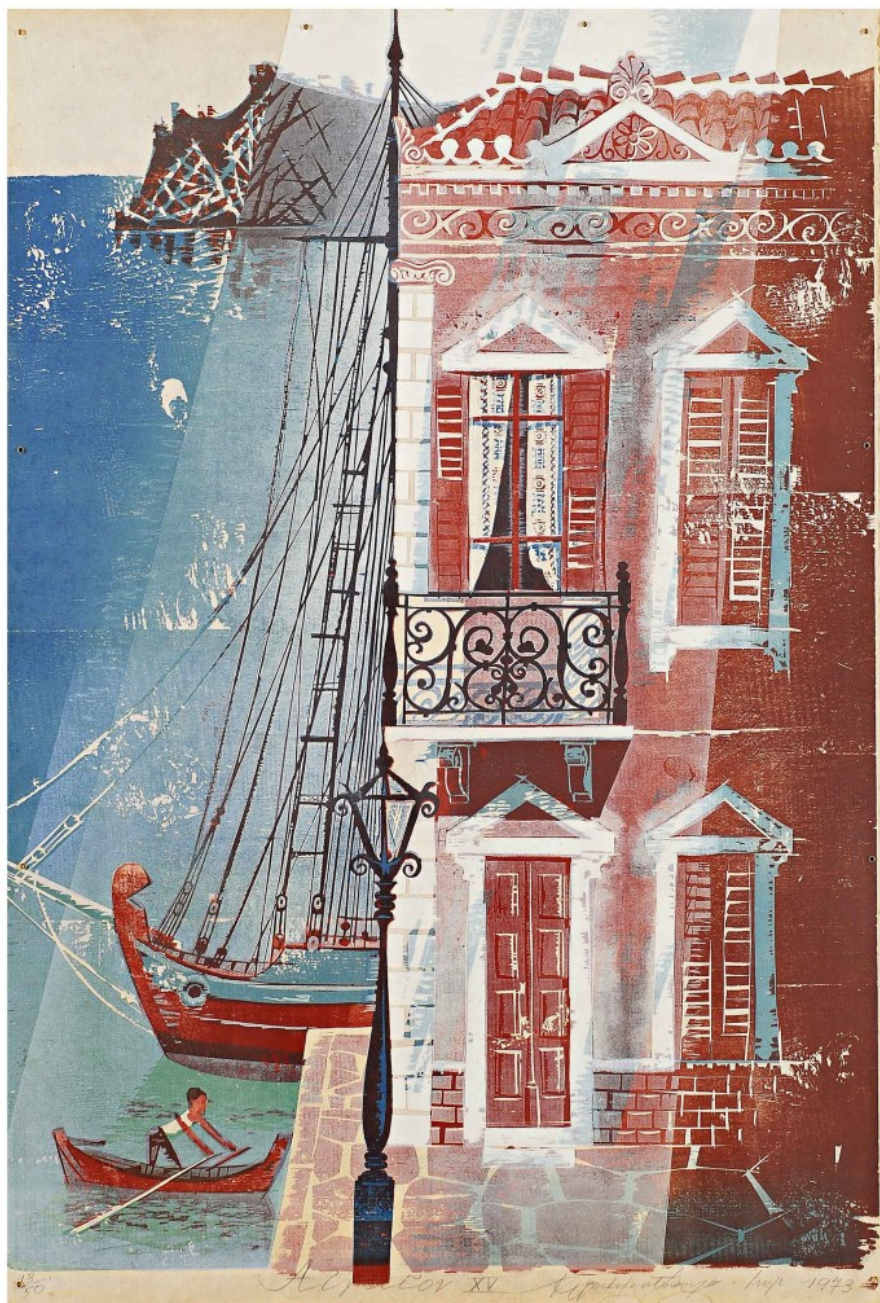
Αιγαίο, 1973, Ξυλογραφία