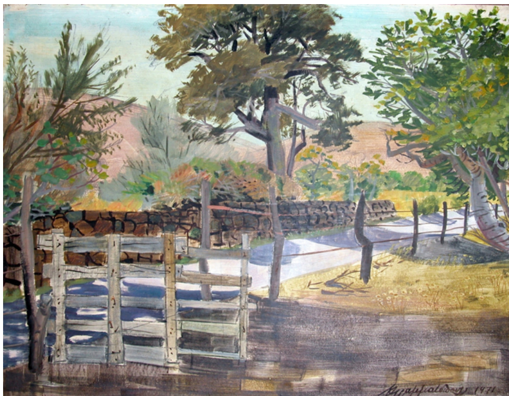
Πηγαίνοντας στην Εφταλού, 1971, ακρυλικό