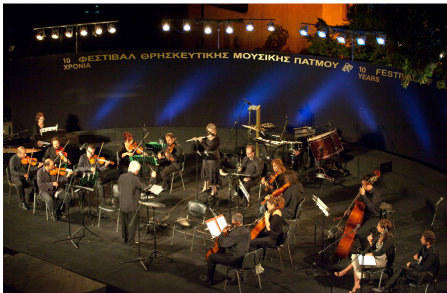
Η Ορχήστρα του Φεστιβάλ Πάτμου

Το δεύτερο μέρος της συναυλίας είναι αφιερωμένο στο Μάνο Χατζηδάκι. Εδώ βέβαια τα κομμάτια που θα ακουστούν, δεν έχουν αμιγώς θρησκευτικό περιεχόμενο. Θεώρησα ότι δεν θα έπρεπε το φεστιβάλ να μην κάνει έστω μία σύντομη αναφορά, στον σπουδαίο αυτό τραγουδοποιό. Θα παίξουμε τραγούδια από τη «Ρωμαϊκή Αγορά», τα τραγούδια αυτά που ταιριάζουν στο χώρο, τραγούδια με ευαισθησία και υψηλή αισθητική. Ένας στενός συνεργάτης του Χατζηδάκι, ο Βασίλης Γισδάκης θα ερμηνεύσει τα τραγούδια του. Αξίζει να σημειωθεί ότι για τον Ελ Γκρέκο και τον Χατζηδάκι θα διαβαστούν στοιχεία για τη ζωή και το έργο τους.