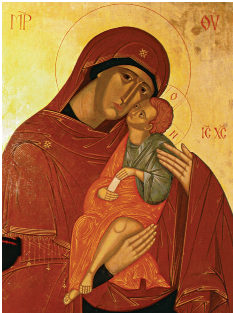
Εικόνα Παναγίας τέμπλου τού ιερού ναού τού Αγίου Σιλουανού. Έργο τού Γέροντα Σωφρονίου.

Συνειδητοποιώντας από την προσωπική μου εμπειρία ότι κάθε αλλαγή στην κατανόησή μου του θείου Είναι επηρέαζε αναπόφευκτα ολόκληρη την ζωή μου, μου έδειχνε ότι κάθε ομολογία η μορφή μυστικισμού έχει την δική της συγκεκριμένη πνευματικότητα. Γι' αυτόν τον λόγο είμαι απόλυτα πεπεισμένος ότι ο χαρακτήρας της ασκητικής ζωής του αγίου Σιλουανού ανήκει καθ' ολοκληρία στην Ορθόδοξη Εκκλησία. Έγραφε ο ίδιος, όταν κάποιος από τους πατέρες κατέληξε ότι όλοι οι αιρετικοί θα αφανισθούν: «Δεν γνωρίζω σχετικά με αυτό το θέμα. Αλλά πιστεύω μόνο στην Ορθόδοξη Εκκλησία. Σε αυτήν υπάρχει η χαρά της σωτηρίας μέσω της ταπεινώσεως του Χριστού». Η ζωή κάθε χριστιανικής ομολογίας, σε όλα τα επίπεδα, ρυθμίζεται από την κατανόηση της Αγίας Τριάδος. Οι διαφορές στην θεολογική ερμηνεία της Υποστατικής Αρχής εν τω Θεώ Είναι αποτελούν διαχωριστική γραμμή, γραμμή οροθεσίας, όχι μόνο μεταξύ των διαφόρων θρησκειών αλλά και μεταξύ των διαφόρων χριστιανικών ομολογιών. Δυστυχώς, οι περισσότεροι σύγχρονοι θεολόγοι δεν το έχουν ακόμη καταλάβει αυτό, αν και είναι το κατ' εξοχήν βασικό σημείο που πρέπει να επιλύσουν.