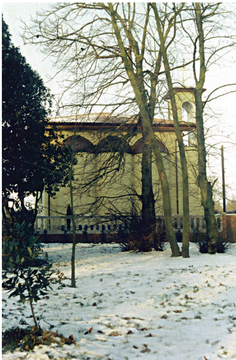
Ο ναός τού Αγίου Σιλουανού στήν Ιερά Μονή Τιμίου Προδρόμου Essex.

Συνεπώς, σε ο,τι αφορά το δημιουργικό έργο, ο άνθρωπος στην τελική του αναζήτηση εγκαταλείπει σταδιακά ο,τι είναι παροδικό και σχετικό, προκειμένου να φθάσει στην αθάνατη τελειότητα. Σε αυτήν την γη, είναι σίγουρο ότι η τελειότητα δεν είναι ποτέ απόλυτη. Παρ' όλα αυτά μπορούμε να ονομάσουμε τέλειους αυτούς που λένε μόνο αυτό που τους έχει δοθεί από το Πνεύμα, κατά μίμηση του Χριστού, ο οποίος λέει: «Απ' εμαυτού ποιώ ουδέν, αλλά καθώς εδίδαξέ με ο πατήρ μου, τάυτα λαλώ» 6 .