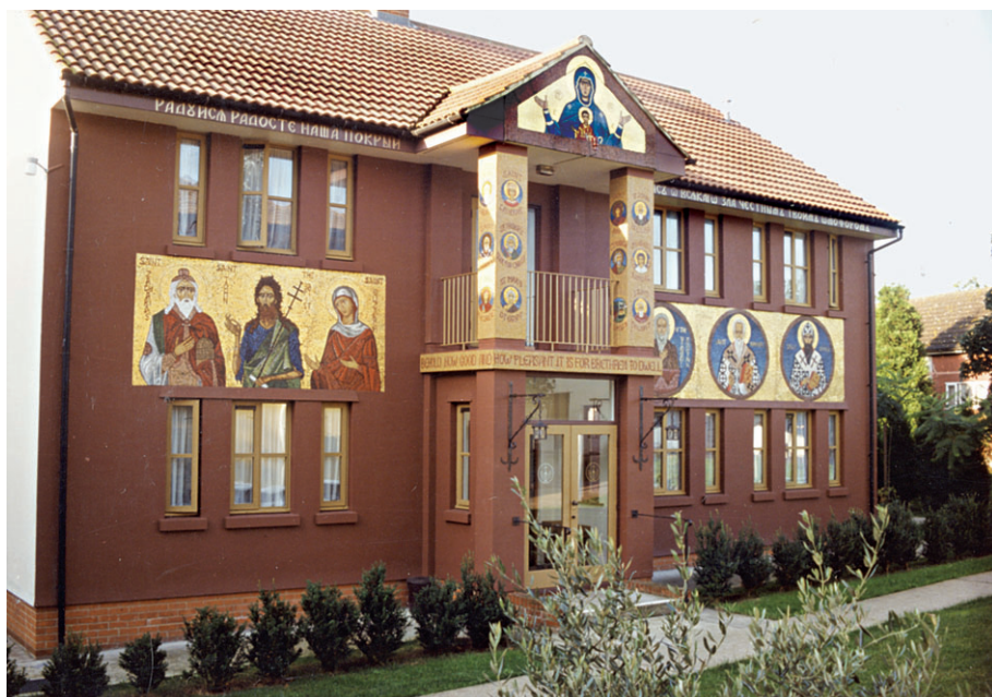
Τό ηγουμενείο τής Ιεράς Μονής τού Τιμίου Προδρόμου Essex. Βόρεια πρόσοψη μέ τά ψηφιδωτά.

Είναι αλήθεια, ότι χάρη στα βιβλία σας, αλλά αναμφίβολα και γιατί αυτό είναι το σχέδιο του Θεού, η ευλάβεια προς τον άγιο Σιλουανό έχει ήδη ξεπεράσει τα «όρια» της Ορθόδοξης Εκκλησίας. Η επιρροή του είναι πολύ μεγάλη. Συγκινεί πολλές καρδιές.