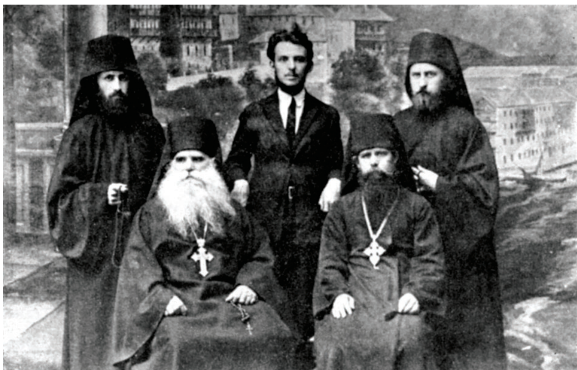
Οι νεοκαρέντες μοναχοί Βασίλειος Κριβοσέϊν, μετέπειτα αρχιεπίσκοπος Βρυξελλών (όρθιος αριστερά), και Σωφρόνιος Σαχάρωφ, μετέπειτα κτήτωρ τής Ι. Μ. Τιμίου Προδρόμου (όρθιος δεξιά). Φωτογραφία στην Ι. Μονή αγίου Παντελεήμονος Αγίου Όρους, 1926.

Είναι σίγουρο ότι ο άγιος Σιλουανός είναι ένας άγιος που συγκαταχωρείται στην χορεία, στην παράδοση των μεγάλων πνευματικών Ορθοδόξων Πατέρων, αλλά έζησε και εξέφρασε αυτό που ζούσε με ένα τρόπο εντελώς πρωτότυπο. Επί πλέον γράφει για πράγματα εξαιρετικά βαθιά με λέξεις πολύ απλές. Αυτό που λέτε σχετικά με το θέμα αυτό είναι πολύ σημαντικό και πολύ διαφωτιστικό.