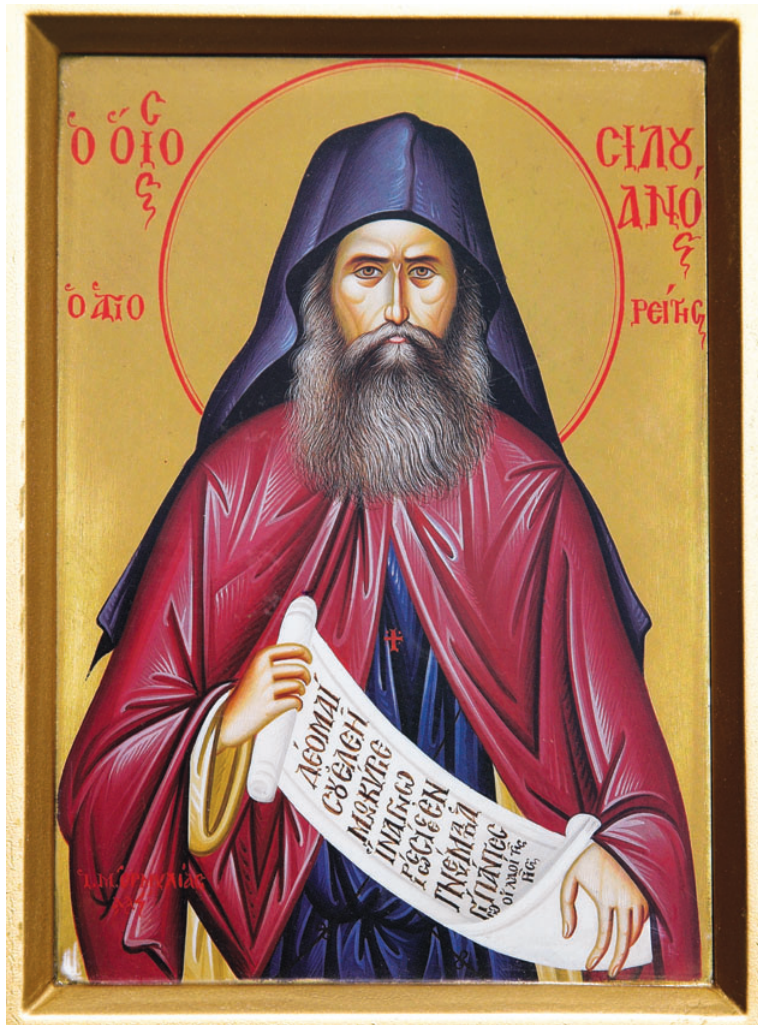
Ο άγιος Σιλουανός ο Αγιορείτης. Φορητή εικόνα Ι.Μ. Ευαγγελισμού τής Θεοτόκου, Ορμύλια.

Ας έλθουμε τώρα στο δεύτερο ερώτημά μου: Πως μπορούμε να είμαστε σίγουροι ότι το πνεύμα που ενεργεί μέσα μας είναι στ' αλήθεια το Τρίτο Πρόσωπο της Αγίας Τριάδος, και όχι κάτι άλλο; Ο άγιος Ιωάννης ο Θεολόγος μας προτρέπει να προσέχουμε: «Μη παντί πνεύματι πιστεύετε, αλλά δοκιμάζετε τα πνεύματα ει εκ του Θεού εστιν» 4 . Αυτό είναι ζωτικής σημασίας για τον κάθε ένα από μας. Σύμφωνα με την διδασκαλία του αγίου Σιλουανού, του δόθηκε από το Άγιο Πνεύμα να γνωρίσει την θεότητα του Χριστού· γνώρισε τον Θεό εν Αγίω Πνεύματι. Το ομοούσιο του Υιού και του Αγίου Πνεύματος γίνεται περισσότερο αντιληπτό από το γεγονός ότι όταν το Πνεύμα, που εκπορεύεται εκ του Πατρός, επισκεφθεί αληθινά την ψυχή, βιώνει η ψυχή το σύνολο του περιεχομένου των εντολών του Χριστού. Γι' αυτόν τον λόγο, αν το πνεύμα που υπάρχει μέσα μας είναι σε πλήρη συμφωνία με τις εντολές του Ευαγγελίου, τότε είναι πραγματικά το Άγιο Πνεύμα. Έτσι ο Υιός και το Άγιο Πνεύμα αμοιβαίως μαρτυρούν ο ένας για τον άλλο. Το Άγιο Πνεύμα είναι το Φως της αιωνίου ζωής· η πνοή του Αγίου Πνεύματος μέσα μας είναι η δύναμη της θείας αγάπης που εμπνέει στην ψυχή μια βαθιά συμπόνια για όλους, συμπεριλαμβανομένων και των εχθρών. Και η ψυχή αισθάνεται αυτήν την