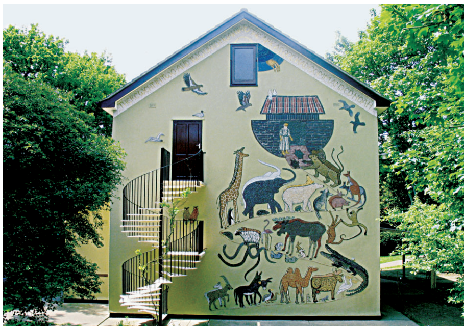
Ψηφιδωτό «Κιβωτός του Νώε». Ανατολική όψη τής Βιβλιοθήκης τής Ι.Μ. Τιμίου Προδρόμου, Essex.

Θέλετε να μας μιλήσετε λίγο για τις σχέσεις σας με τον άγιο Σιλουανό; Πότε και πως άρχισαν;