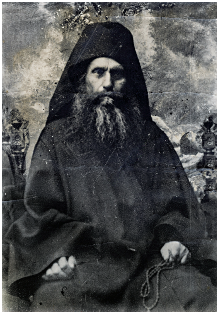
Ο άγιος Σιλουανός γεννήθηκε τό 1866 στό χωριό Σόβσκ τής επαρχίας Λεμπεντίασκ τής Ρωσίας. Πήγε στό Άγιον Όρος, στήν Ι. Μ. Αγίου Παντελεήμονος τό 1892, εκάρη μεγαλόσχημος μοναχός τό 1911 καί κοιμήθηκε τό 1938.

Και ο Θεός επέτρεψε να ζείτε μέχρι τώρα, για να νιώσετε την χαρά για την αγιοκατάταξη του πνευματικού σας πατρός!