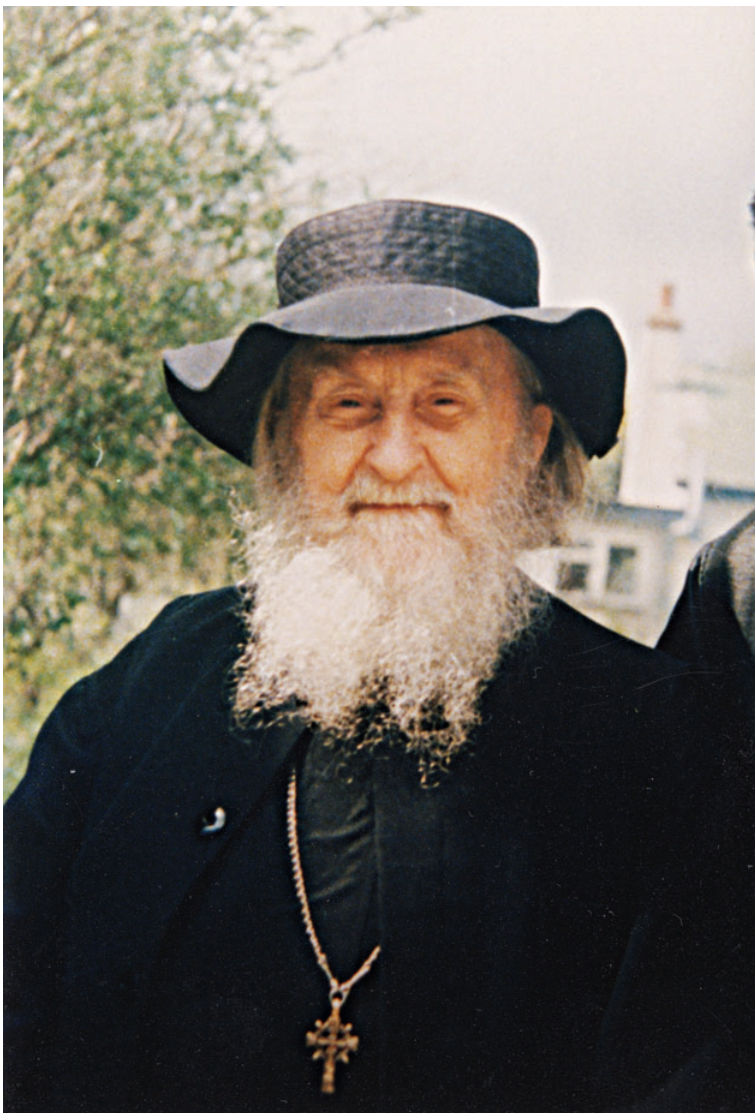
Γ. Σωφρόνιος: «Μετά από τήν πρώτη επικοινωνία μας

Γέροντας Σωφρόνιος: Είναι η καρδιά που υποφέρει, δεν είναι στα λόγια. Το μυστικό είναι εκεί: Όπου είναι η καρδιά, εκεί είναι η χαρά και το φως· έπειτα, ο νους ενώνεται με την καρδιά, αλλά η καρδιά είναι γεμάτη από πόνο, σαν να βγαίνει το αίμα από την καρδιά. Να αυτό που έχω καταλάβει: Όταν προσευχόμαστε με αυτόν τον τρόπο για ολόκληρη την ανθρωπότητα, αυτό είναι σημείο ότι έχει δοθεί σε ένα ανθρώπινο πρόσωπο, σε μια υπόσταση, η χάρις να βιώσει το εξής: Μπορεί να φέρει εντός του και τον Θεό και ολόκληρη την ανθρωπότητα. Και ο Θεός και ολόκληρη η ανθρωπότητα είναι το περιεχόμενο της ζωής αυτού του προσώπου. Το να ζεις χριστιανικά είναι να πλατύνεις το περιεχόμενο της ζωής σου με έναν τρόπο πρωτοφανή!