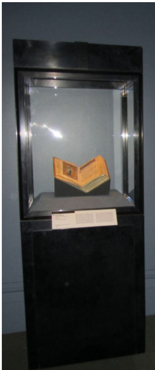
Το Βυζαντινό χειρόγραφο της Ι. Μονης Διονυσίου

«Η προσπάθεια», που κάνει το Υπουργείο Πολιτισμού «προκειμένου να στοιχειοθετήσει με τρόπο επιστημονικά αδιαμφισβήτητο τις απαιτήσεις της Ελλάδας και για την επιστροφή των πολιτιστικών θησαυρών της», δικαιώνεται επεσήμανε ο Πρωθυπουργός. «Αλλά πρέπει να συνεχιστεί. Και βέβαια η κορύφωσή της θα είναι η επανένωση του συνόλου των γλυπτών του Παρθενώνα, η οποία συνένωση αυτή αποτελεί τη μόνιμη, σταθερή, απαραίτητη απαίτησή μας».