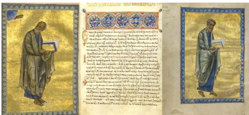
Λεπτομέρεια του χειρογράφου

Επανερχόμαστε στο θέμα του επαναπατρισμού χειρογράφου Ευαγγελίου από το Μουσείο Getty, με αφορμή την εκδήλωση που έγινε χθες, Δευτέρα 15 Σεπτεμβρίου, στο Βυζαντινό και Χριστιανικό Μουσείο, παρουσία του Πρωθυπουργού Αντώνη Σαμαρά.