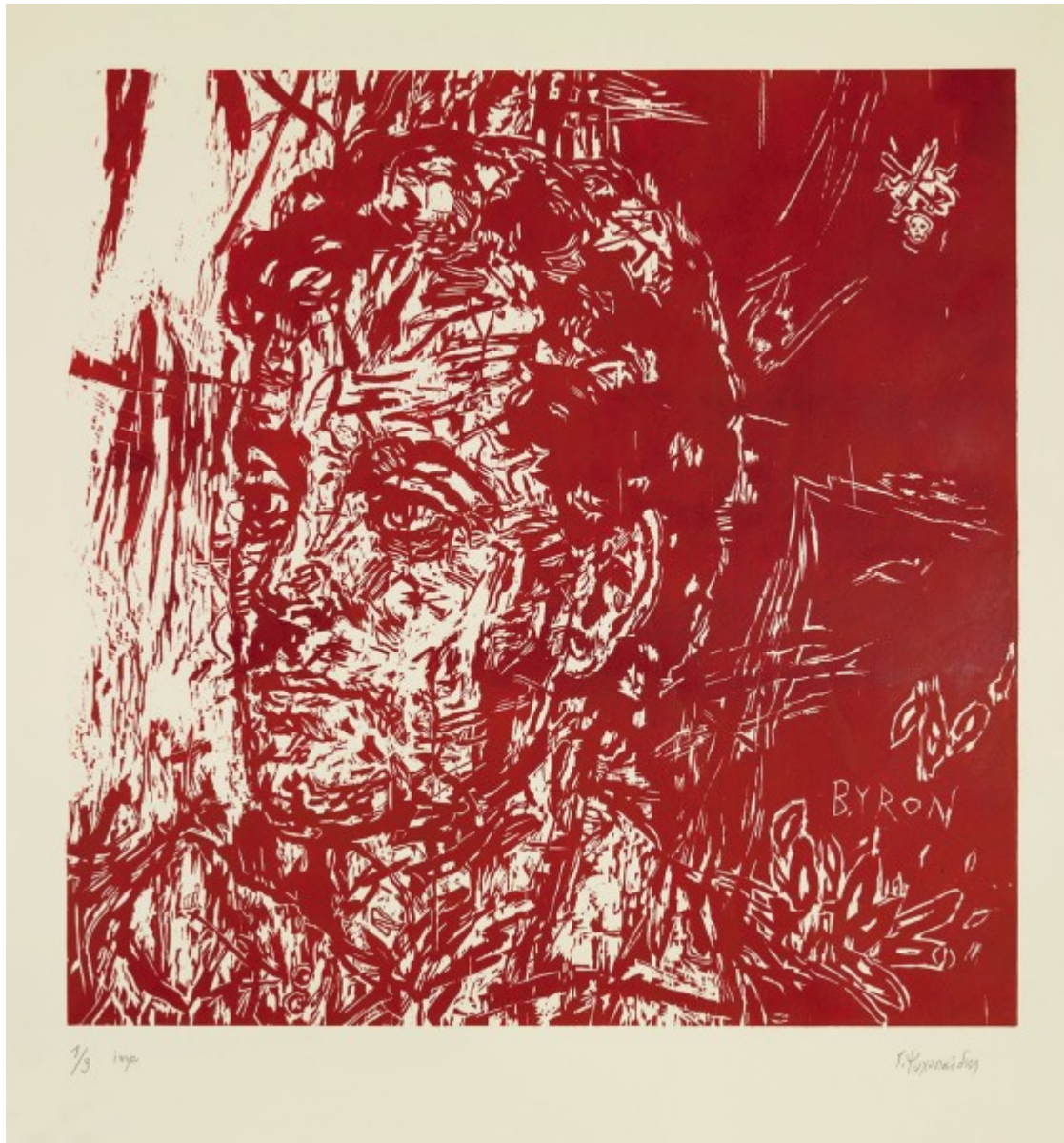
Byron III, 2014, ξυλογραφία 100X100 εκ

Ποια είναι όμως η σχέση της ποίησης με τη ζωγραφική;