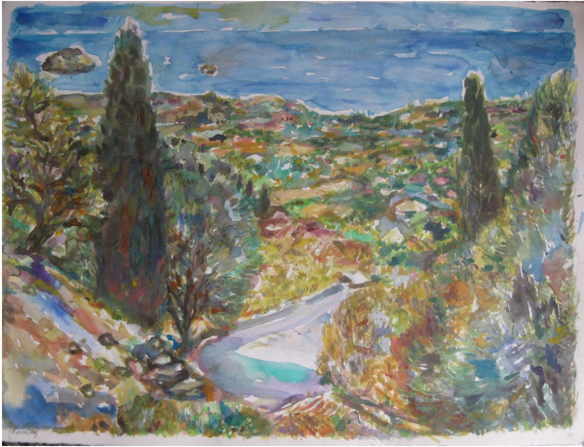
Κεφαλονιά, Αύγουστος, 2007

το σπίτι που ζούσε ο Βύρωνας από τον Αύγουστο του 1823 και για τέσσερις μήνες, όταν έφτασε στο νησί για να στηρίξει τον απελευθερωτικό αγώνα των Ελλήνων.