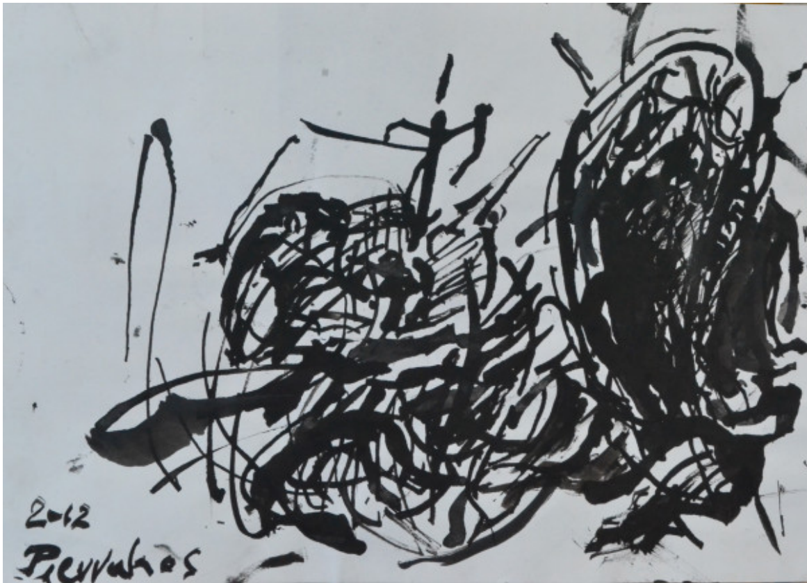
LEPANTO 2011-2012-A

Η Ναυμαχία της Ναυπάκτου (7 Οκτωβρίου 1571), υπήρξε μία από τις σημαντικότερες ναυμαχίες για πολλούς λόγους: αποτέλεσε μία περιφανή νίκη των Χριστιανικών δυνάμεων έναντι των Οθωμανών, η οποία καθόρισε την Ευρωπαϊκή ιστορία, αλλά και σταθμό στη ναυτική τακτική και στη ναυπηγική , καθώς υπήρξε το τέλος των κωπήλατων πλοίων και το ξεκίνημα των ιστιοφόρων.