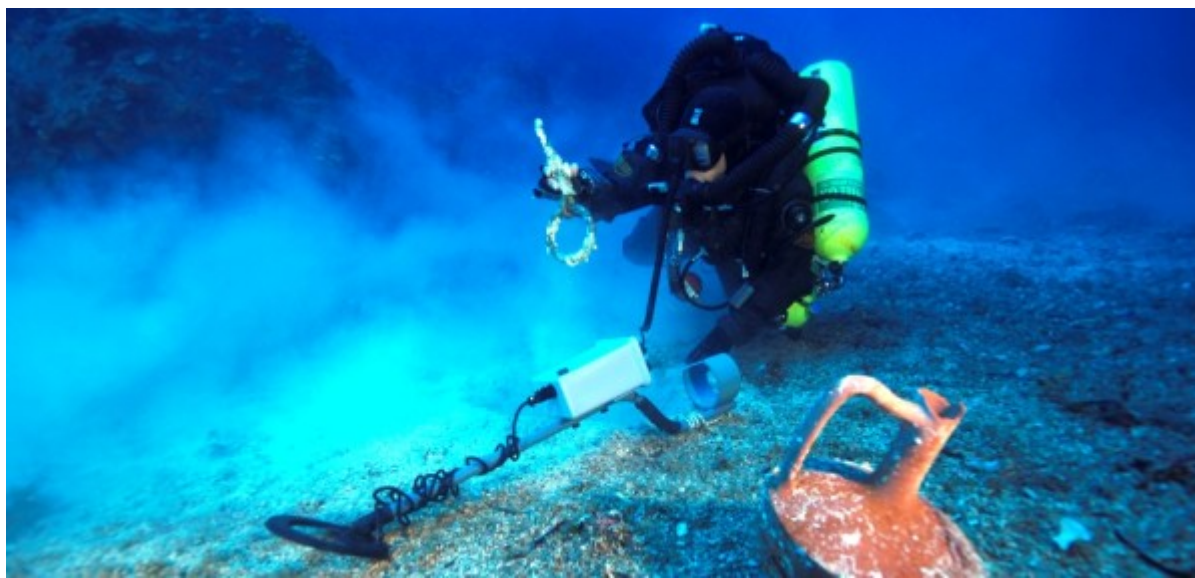
Ανίχνευση μετάλλων . Χάλκινος δακτύλιος και λάγυνος που ανελκύστηκαν

Το πιο σημαντικό και συναρπαστικό εύρημα ήταν ο λεγόμενος Μηχανισμός των Αντικυθήρων . Θα μπορούσε να πει κανείς ότι ήταν ένας φορητός μηχανικός υπολογιστής των κινήσεων της Σελήνης, του Ήλιου και των πέντε πλανητών, που φτιάχτηκε μάλλον γύρω στο 150-100 π.Χ. αλλά και ένα ακριβές ημερολόγιο που μπορούσε να προβλέπει τις σεληνιακές και τις ηλιακές εκλείψεις. Παραμένει μυστήριο, καθώς πολλά από τα μυστικά που τον περιβάλλουν, δεν έχουν ακόμα αποκαλυφθεί.