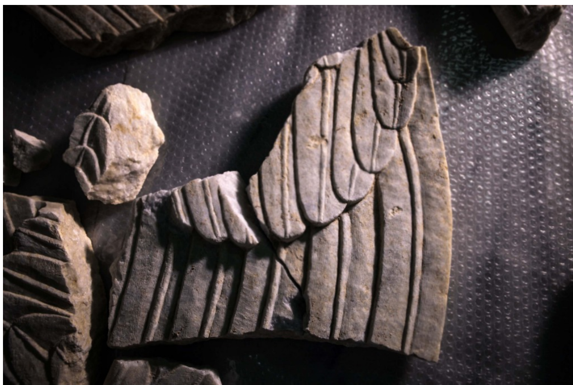
Λεπτομέρεια από τις σφίγγες, φωτο 2

Επίσης, δόθηκαν στη δημοσιότητα φωτογραφίες από τα τμήματα των φτερών των Σφιγγών. Τα ευρεθέντα τμήματα επιτρέπουν την πλήρη αποκατάστασή τους. Σχετικό σχέδιο έχει εκπονηθεί από τον αρχιτέκτονα του Υπουργείου Πολιτισμού και Αθλητισμού, Μ. Λεφαντζή και παρουσιάζεται, για πρώτη φορά, σήμερα.