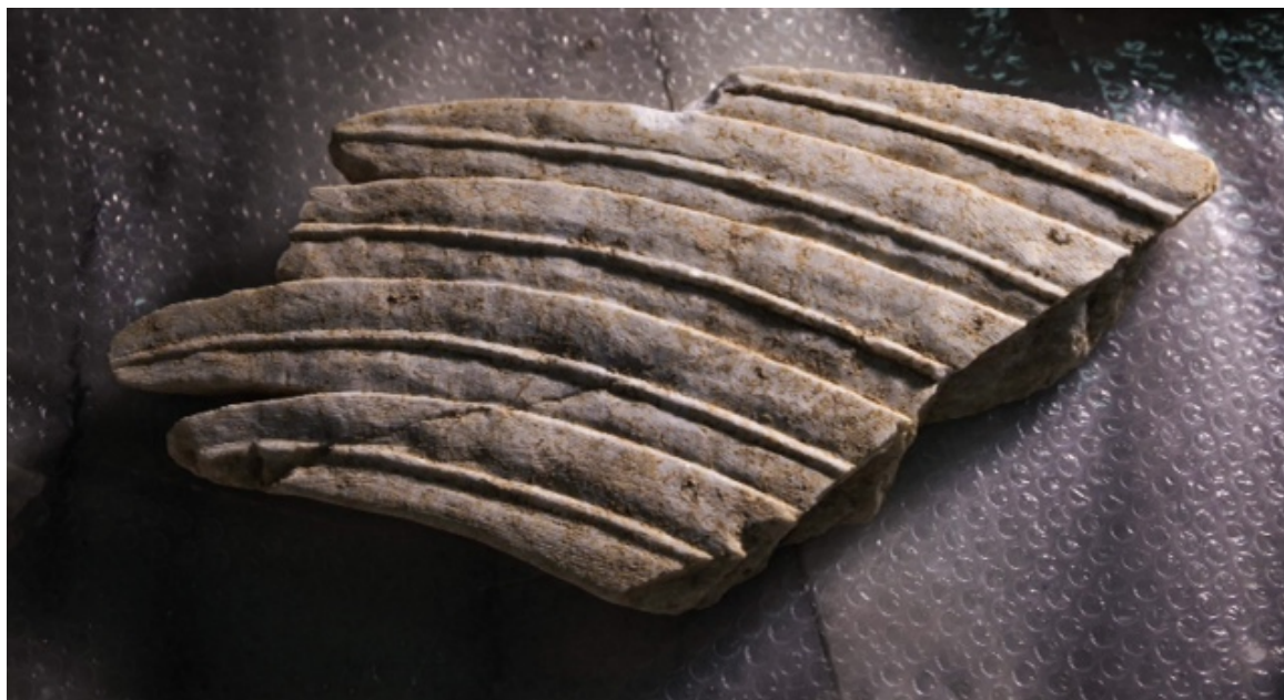
Λεπτομέρεια από τις σφίγγες, φωτο 1

Επίσης, δόθηκαν στη δημοσιότητα φωτογραφίες από τα τμήματα των φτερών των Σφιγγών. Τα ευρεθέντα τμήματα επιτρέπουν την πλήρη αποκατάστασή τους. Σχετικό σχέδιο έχει εκπονηθεί από τον αρχιτέκτονα του Υπουργείου Πολιτισμού και Αθλητισμού, Μ. Λεφαντζή και παρουσιάζεται, για πρώτη φορά, σήμερα.