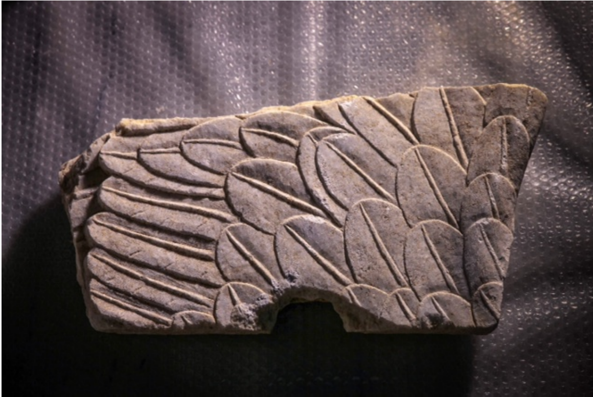
Λεπτομέρεια από τις σφίγγες, φωτο 3

έχει δεχθεί σαφέστατα ανθρώπινη παρέμβαση, μέχρι εδώ που βρισκόμαστε. Από την αρχή της ενημέρωσης είχαμε πει-κι έχουμε πολλές φορές επαναλάβει-ότι έχουμε ισχυρότατες ενδείξεις δράσης τυμβωρύχων».