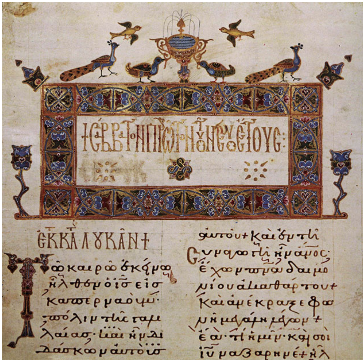
Ευαγγελιστάριο με εκφωνητικά σημάδια.

Η εμμελής απαγγελία ήταν σε χρήση στην λατρεία της Εκκλησίας από τους πρώτους χριστιανικούς αιώνες. Ο Αριστείδης Κοϊντιλιανός θεωρητικός του 3ου αι μ.Χ. αποκαλεί την εκφωνητική απαγγελία ως «μέση φωνή», κάτι μεταξύ συνεχούς και διαστηματικής φωνής.