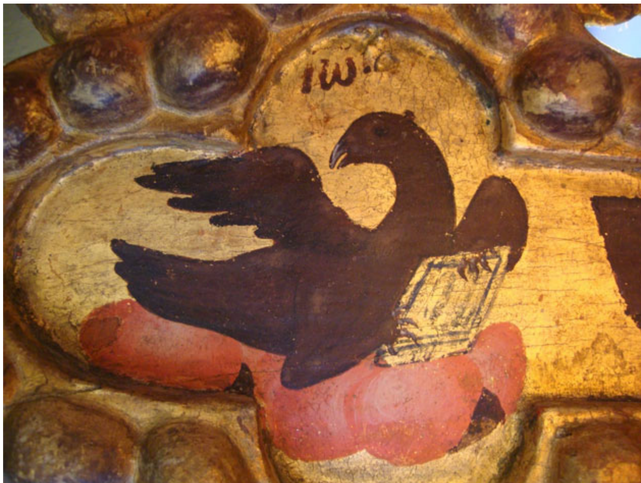
Ο Ευαγγελιστής Ιωάννης - Αετός. Λεπτομέρεια αριστερού άκρου κεραίας Σταυρού τέμπλου του Ιερού Ναού Εισοδίων της Θεοτόκου Χαροκοπίου Ιωαννίνων, 18ος αιων.

Σε μια σύνοψη ιερών κειμένων του αγίου Αθανασίου, για τον οποίο σήμερα ξέρουμε ότι δεν είναι ο επίσκοπος Αλεξανδρείας, αλλά κάποιος που έζησε τον 6ο ή το 10ο αι., ο άγγελος-άνθρωπος συνδέεται με το Ματθαίο, ο αετός με τον Ιωάννη, ο μόσχος με το Μάρκο και ο λέων με το Λουκά.