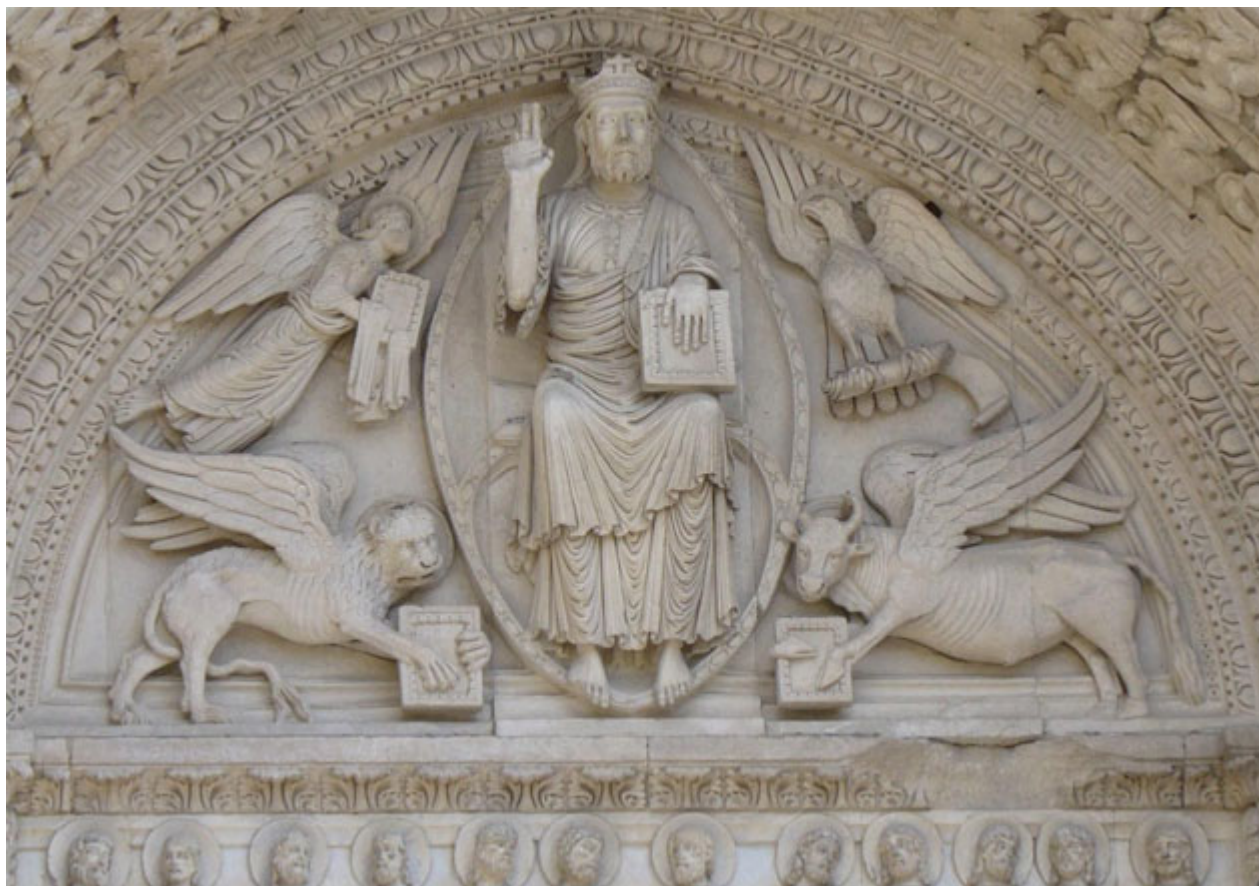
«Η δόξα του Χριστού», ανάγλυφο από την πρόσοψη του Γοθικού ναού του Αγίου Τροφίμου στην Αρλ της Γαλλίας, 1180.

Η σύνδεση αυτή των τεσσάρων ευαγγελιστών με τα τέσσερα ζώδια έγινε, με αφορμή τα παραπάνω κείμενα, από τους πατέρες της Εκκλησίας, οι οποίοι όμως πρότειναν διάφορες ερμηνείες αυτών των κειμένων. Ο πρώτος μεταξύ αυτών που ερμήνευσε το τετράμορφο χερουβείμ του οράματος του Ιεζεκιήλ ως προεικόνιση των τεσσάρων ευαγγελιστών ήταν ο επίσκοπος της Λυών Ειρηναίος, ο οποίος συνέδεσε τον άνθρωπο με το Ματθαίο, τον αετό με το Μάρκο, το μόσχο με το Λουκά και το λέοντα με τον Ιωάννη. Ακολουθήθηκε από τη Δύση, ενώ η Ανατολή συνδέθηκε με τις ερμηνείες του Ανδρέα Καισαρείας (γ614), του Αναστασίου Σιναΐτη (ηγούμενου της μονής Σινά, που πέθανε μετά το 700) και άλλων.