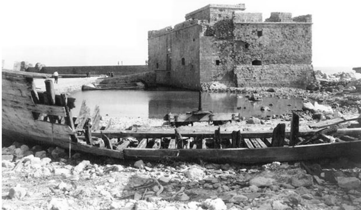
ΠΑΦΟΣ - ΛΙΜΑΝΙΑ ΤΗΣ ΚΥΠΡΟΥ ΣΤΗΝ ΕΚΘΕΣΗ ΟΛΚΑΣ II.

Η έκθεση αποτελεί ένα φωτογραφικό ταξίδι στον μαγευτικό κόσμο της Ανατολής. Μέσα από χάρτες, πορτολάνους, χαρακτηριστικά, μικρογραφίες χειρογράφων, ταχυδρομικά δελτάρια και φωτογραφίες από τον 12ο αι. έως και σήμερα, παρουσιάζονται ποικίλες όψεις 60 λιμανιών του Ευξείνου Πόντου, του Αιγαίου και της Κύπρου, που αναδεικνύουν το πλούσιο μεσαιωνικό παρελθόν των αντίστοιχων χωρών. Η έκθεση έχει τον τίτλο «ΟΛΚΑΣ II» εμπνευσμένη από το εμπορικό πλοίο των Βυζαντινών, το οποίο για αιώνες μετέφερε στις θάλασσες της Ανατολής ανθρώπους και προϊόντα, και δι' αυτών καλλιτεχνικές αξίες και πολιτιστικά αγαθά, τα οποία επηρέασαν τη διαμόρφωση του μεσαιωνικού πολιτισμού εντός και εκτός της βυζαντινής αυτοκρατορίας. Συνοδεύεται από δίγλωσσο κατάλογο (ελληνικά-αγγλικά).