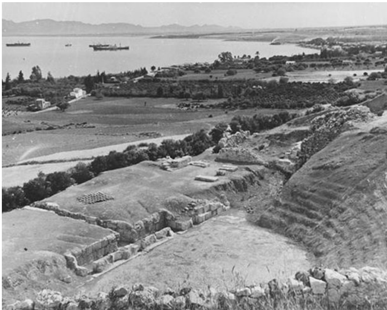
ΣΟΛΟΙ-ΚΑΡΑΒΟΣΤΑΣΙ-ΞΕΡΟΣ - ΛΙΜΑΝΙΑ ΤΗΣ ΚΥΠΡΟΥ ΣΤΗΝ ΕΚΘΕΣΗ ΟΛΚΑΣ II.