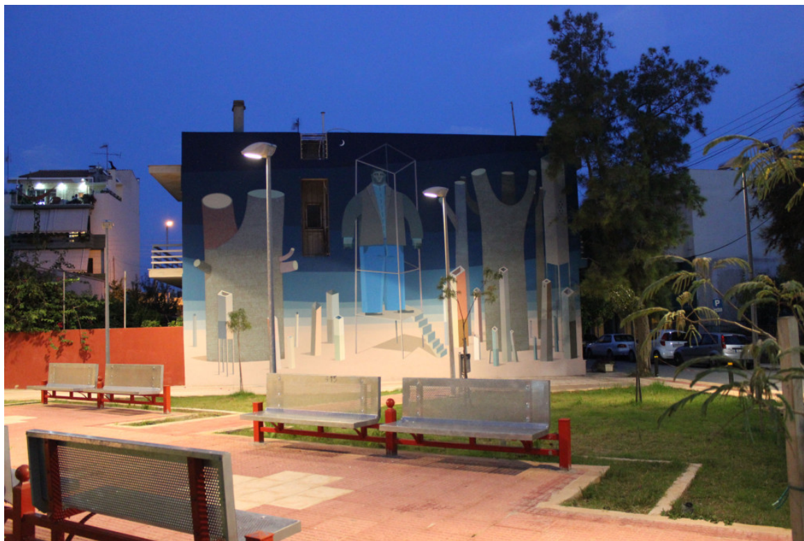
Σύγχρονη άποψη της πόλης