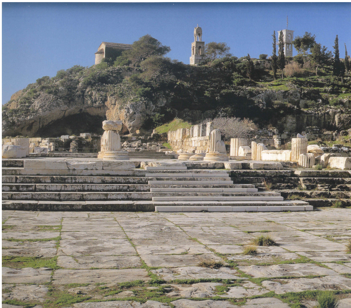
Αρχαιολογικός χώρος της Ελευσίνας

Άλλωστε, όπως επισημάνθηκε, η διεκδίκηση του τίτλου στοχεύει στη δυναμική ανάπτυξη της πόλης και στην ένταξή της στο χάρτη των δημιουργικών πόλεων της Ευρώπης. Πιο συγκεκριμένα ως μία από τις πέντε ιερές πόλεις της αρχαιότητας, αλλά και ως κατεξοχήν βιομηχανικό κέντρο στη σύγχρονη εποχή, η φυσιογνωμία της Ελευσίνας διαμορφώνεται μέσα από μία διαρκή διαδικασία σύνθεσης των αντιθέτων. Στην ίδια διαδικασία βρίσκεται σήμερα και η Ευρώπη στο σύνολό της, στην προσπάθειά της να υπάρξει ως ενιαία οντότητα και ως Ευρωπαϊκή Ένωση. Υπό αυτή την προοπτική, η Ελευσίνα βρίσκεται στην καρδιά του ευρωπαϊκού προβληματισμού. Αν στα παραπάνω προστεθεί και η σημαντική πολιτιστική δραστηριότητα που έχει αναπτύξει η πόλη τις τελευταίες δεκαετίες, η Ελευσίνα εμφανίζει μία σειρά ισχυρά επιχειρήματα για την ανάδειξή της σε Πολιτιστική Πρωτεύουσα της Ευρώπης, το 2021.