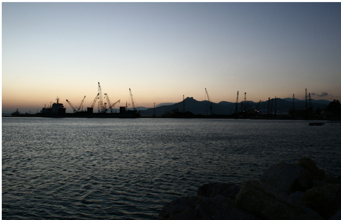
Το Λιμάνι της πόλης

Πριν από λίγες ημέρες έγινε η επίσημη παρουσίαση, από τον δήμαρχο της πόλης Γιώργο Τσουκαλά, της πρότασης να αναδειχθεί η Ελευσίνα, ως υποψήφια πόλη – πολιτιστική πρωτεύουσα της Ευρώπης το 2021. Την υποψηφιότητα της Ελευσίνας υποστήριξε με θερμά λόγια και ο Σπύρος Μερκούρης, ο οποίος σημείωσε: «Είμαι ευτυχής που η πόλη της Ελευσίνας είναι υποψήφια για να γίνει Πολιτιστική Πρωτεύουσα της Ευρώπης το 2021. Ο πολιτισμός αντλεί από το παρελθόν, σχηματίζει το παρόν και ατενίζει το μέλλον. Η Ελευσίνα τα έχει όλα. Άρα θα γίνει μια σπουδαία Πολιτιστική Πρωτεύουσα».