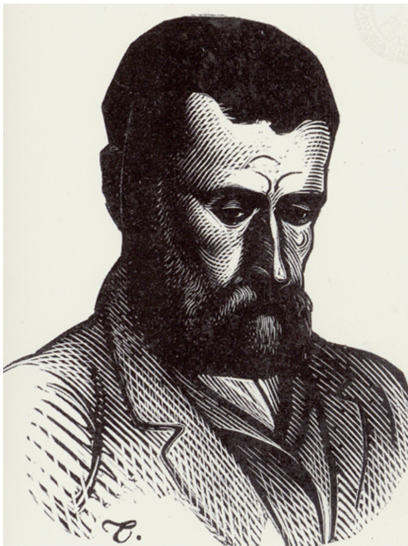
Αλέξανδρος Παπαδιαμάντης, Ξυλογραφία του Τάσσου

Το Ελληνικό Ίδρυμα Πολιτισμού Βελιγραδίου, πραγματοποιεί σήμερα Πέμπτη 21 Μαΐου, αφιέρωμα στον Αλέξανδρο Παπαδιαμάντη που περιλαμβάνει: εγκαίνια ψηφιακής έκθεσης με αρχειακό υλικό από το έργο του Παπαδιαμάντη, βιβλιογραφία, εικαστικές απεικονίσεις κ.ά. και διάλεξη του καθηγητή Miodrag Stojanovic, με θέμα: «Το ηθογραφικό διήγημα του Παπαδιαμάντη».